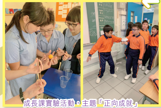
成長課實驗活動，主題「正向成就」

另外，我們讓學生從學習中累積正向經驗，建立正面情緒和快樂感，並推動個人發展正面的元素，如樂觀、愉快和互愛等，積極面對生活中的壓力和挑戰。