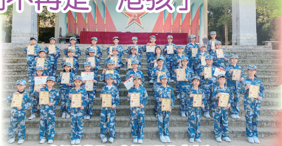
我們畢業了！我們不再是「港孩」！

大部份香港的孩子自小在溫室中長大，總覺得他們經不起風吹雨打，事事依賴別人，亦有人以「六不得」（餓不得、飽不得、熱不得、凍不得、累不得、辛苦不得）描述港孩們。我們的孩子真是這樣脆弱嗎？我卻不太認同，只要有機會，他們一樣可以勇敢面對困難。本校已連續十二年為四年級的同學舉辦兩日一夜的「勇闖黃埔」軍事訓練營，讓他們發揮潛能，面對刻苦的訓練，由報名、面試到入選，教師們都一再向學生強調，訓練過程會非常刻苦及嚴格，而且住宿環境亦較簡陋，但學生們亦踴躍報名，目的是證明自己是個「吃得苦」的孩子。同學們在黃埔軍校接受多項軍事訓練，當中包括長達三小時的步操訓練，學生在陽光下汗流浹背，毫無怨言，在軍官帶領下，同學們展示出一幕幕整齊的軍操，實在令人鼓舞。在學習的過程，學生的自信心、責任感及自律性都得以提升，更能發揮互助互愛的團體精神，他們團結一致及付出努力，最後完成軍事任務，更會獲得廣州市黃埔青少年軍校頒發畢業證書，實在可喜可賀。