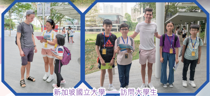
新加坡國立大學——訪問太學生