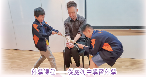
科學課程——從魔術中學習科學