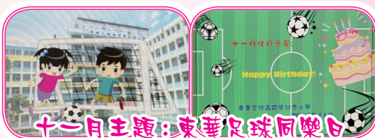
十一月主題：東華足球同樂日