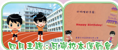
四月主題：可寧校本運動會