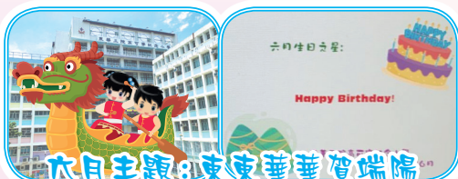
六月主題：東東華華賀端陽