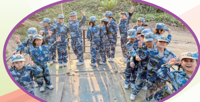
體驗坦克車的速度