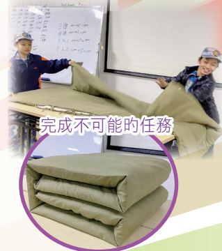
完成不可能的任務