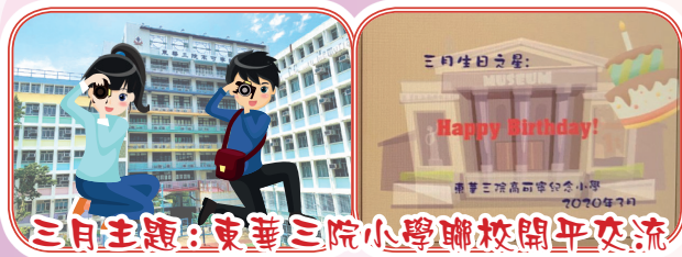
三月主題：東華三院小學聯校開平交流