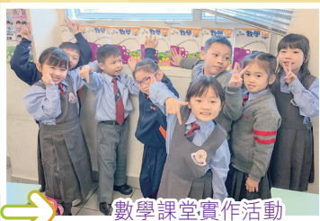
數學課堂實作活動