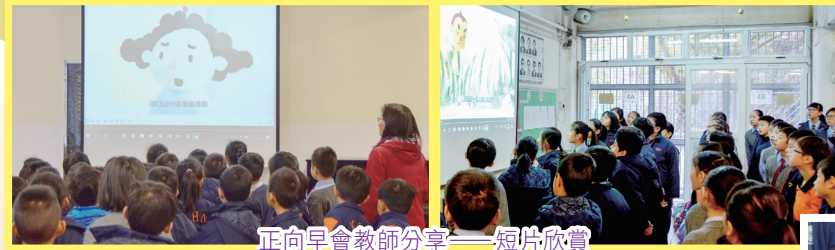
正向早會教師分享——短片欣賞