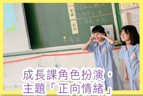
成長課角色扮演，主題「正向情緒」