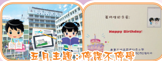
五月主題：停課不停學