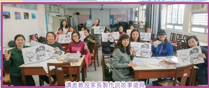
講者教授家長製作說故事道具