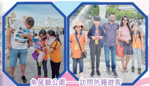
魚尾獅公園——訪問外籍遊客