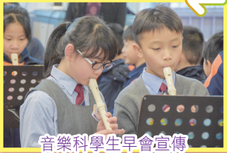
音樂科學生早會宣傳