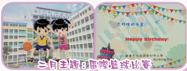
二月主題：國際籃球比賽