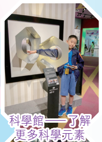
科學館——了解更多科學元素

是次的交流團主要讓學生認識新加坡的國家發展、多元文化特色及城市發展情況；透過閱歷現代化城市規劃，讓學生了解新加坡文化新舊交替之對照，並認識新加坡科技發展的策略安排。這四天的旅程非常緊密，我們參觀當地科技文化展覽及建設：新加坡科學館(Science Centre Singapore)、新生水中心、濱海灣花園(Gardens by the Bay)、濱海堤壩、永續新加坡展覽館(Sustainable Singapore Gallery)；我們參與一節科技課堂，從魔術中學習科學，同學們十分投入。我們還參訪當地大學：新加坡國立大學，讓學生了解大學生生活，亦參訪當地文化建設：魚尾獅公園、牛車水、小印度等，及感受其氛圍。我們還欣賞當地夜景：《幻彩生輝》光影水幕表演及濱海灣花園超級樹燈光秀表演。今次的交流團，各種活動都能讓學生學得其所，除了能擴闊視野，亦帶滿閱歷而回。