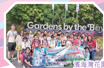
濱海灣花園的日與夜