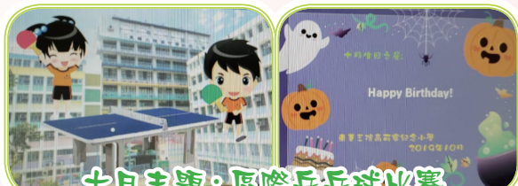
十月主題：國際乒乓球比賽