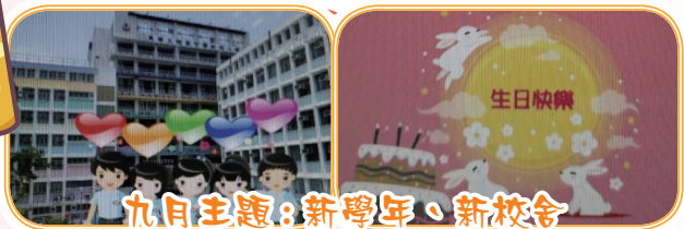
九月主題：新學年、新校舍

「生日祝福滿校園」生日卡的主題是見證同學健康快樂成長，參加多姿多采的活動，各展所長。