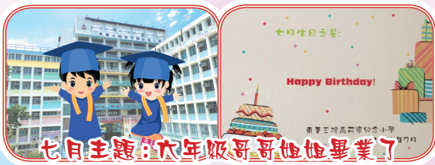
七月主題：六年級哥哥姐姐畢業了