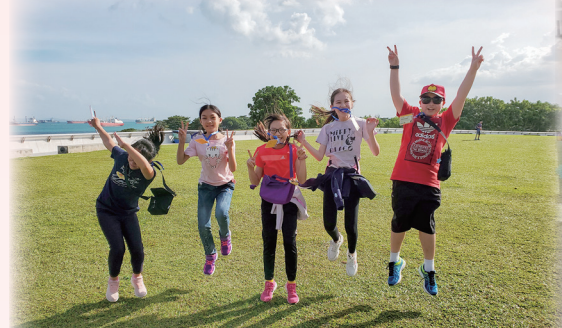
濱海堤壩——城市中的堤壩