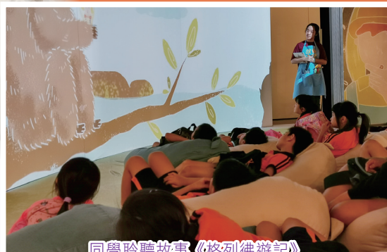
同學聆聽故事《格列佛遊記》