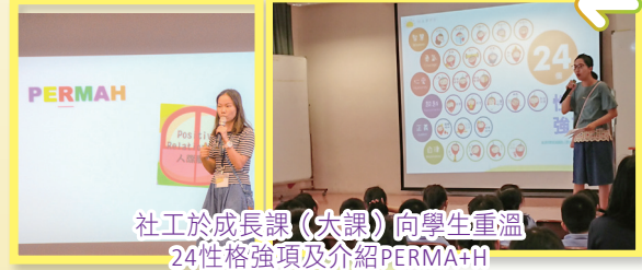
社工於成長課(大課)向學生重溫24性格強項及介紹PERMA+H