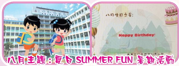
八月主題：夏日 SUMMER FUN 暑期活動