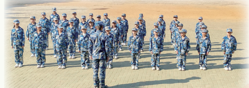
陽光下的軍操訓練