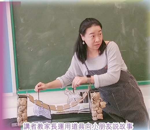
講者教家長運用道具向小朋友說故事

工作坊當天在一片歡笑聲中進行，事後家長們都表示是次工作坊增加了對孩子講故事的信心和能能力。