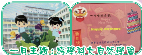
一月主題：跨學科大自然學習