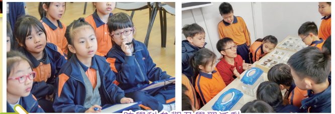
跨學科參觀及學習活動