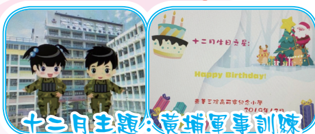
十二月主題：黃埔軍事訓練