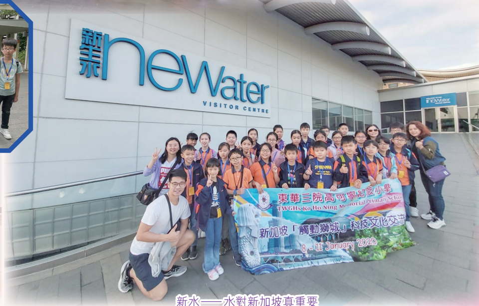
新水——水對新加坡真重要